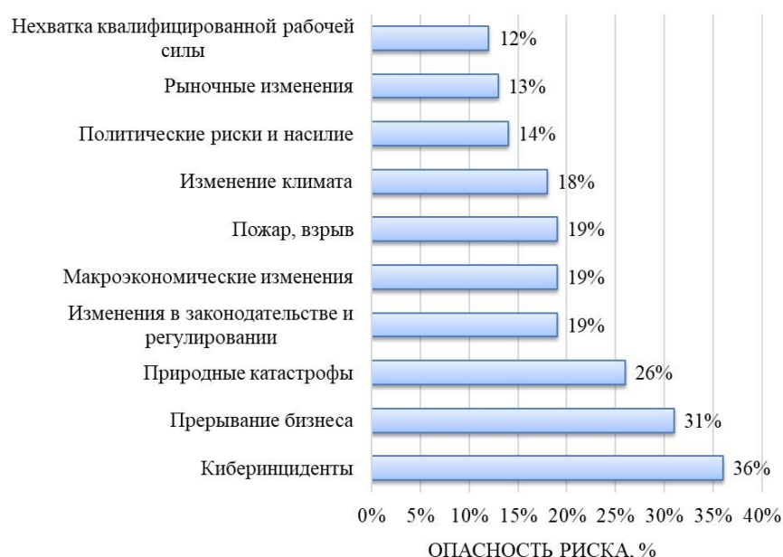
Рисунок 1 – Наиболее важные риски в 2024 году

Ведущая страховая компания Allianz провела опрос с участием 3069 специалистов в области риск-менеджмента из 92 стран и сформировала список пяти наиболее значимых глобальных рисков для 2024 года (рисунок 1) [1].