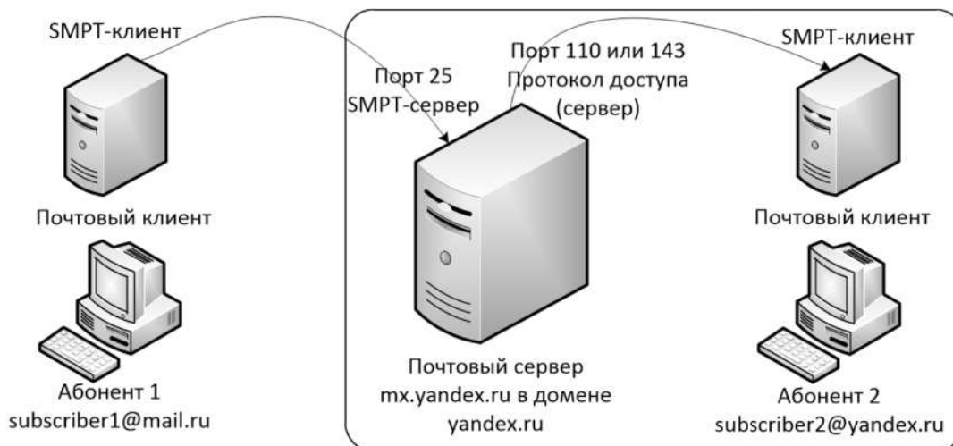
Рисунок 2 – Модель с выделенным почтовым сервером

5) когда Абоненту 2 стало необходимо проверить почту, он запускает свой пользовательский агент и запускает команду проверки почты. После чего почтовый клиент запускает протокол доступа к почтовому серверу. Для доступа к своей корреспонденции используется не SMTP, а специально разработанные для этих задач протоколы POP3 или IMAP [4]. Схема работы представлена на рис. 2.